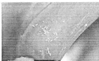
tripsul la ceapa

Condițiile climatice din ultimele zile au favorizat apariția și dezvoltarea daunătorilor: tripsul comun (Thrips spp.) și musca cepei (Hylemia antiqua) generația a II-a.