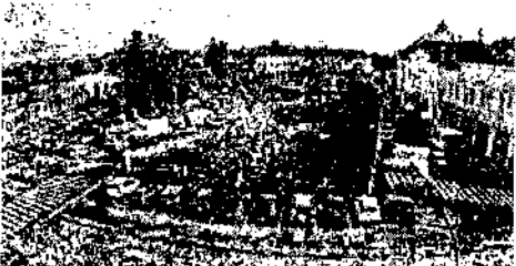
poza3.jpg ~830 KO