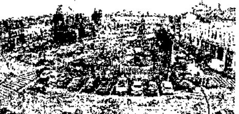
poza5.jpg ~860 KO