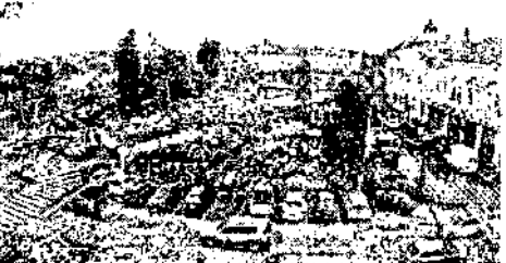
poza4.jpg ~816 KO