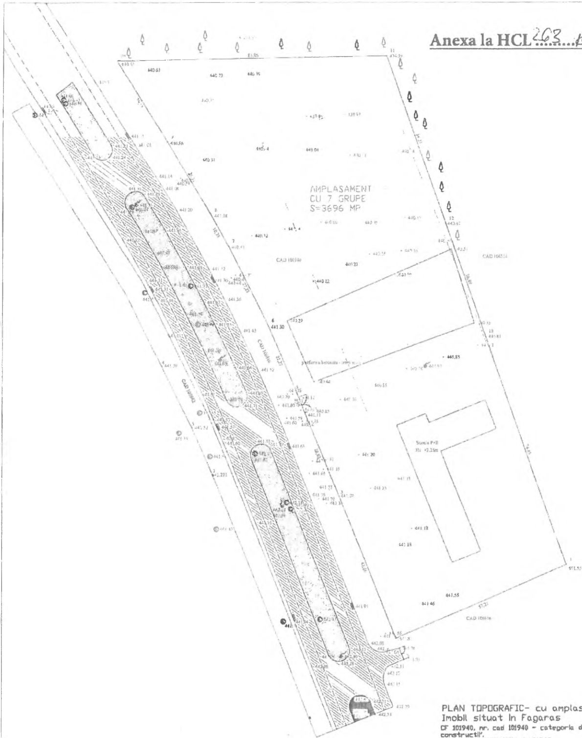
PLAN TOPOGRAFIC - cu amplasament cresa Imobil situat in Fagaras CF 101940, nr. cad 101940 - categoria de folosinta 'curti constructii'. Proprietar: MUNICIPIUL FAGARAS Suprafata din acte - 11385 mp Suprafata masurata - 11385 mp