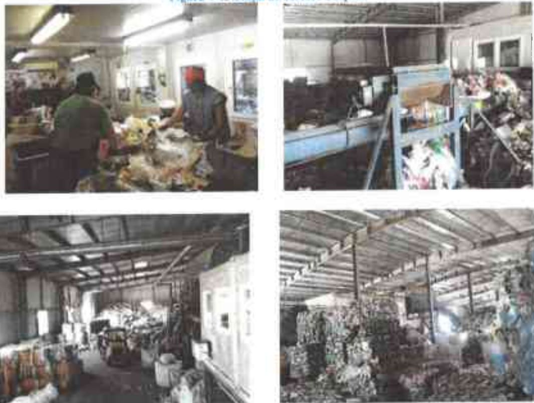
Figura 4-13 Stația de sortare Prejmer

Fluxul tehnologic actual în stația de sortare este prezentată în figura următoare