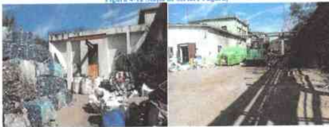
Figura 4-12 Stația de sortare Făgăraș

Hala nu este dotată cu instalații de ventilație, mirosurile degajate sunt puternice. Stația este dotată în prezent cu: 2 prese de balotare, perforator PET, prescontainer de cca. 20 mc, 2 încărcătoare frontale, stivuitor, containere de 32 mc, benzi transportoare. Sticla din colectare separată se depozitează în grămezi și se transportă la reciclator cu containere de 32 mc. În stație se procesează la momentul actual (2018) atât deșeurile reciclabile din colectare separată cât și