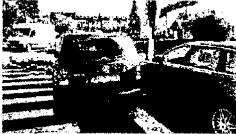
poza7.jpeg ~77 KO