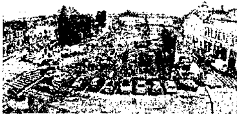
poza2.png ~841 KO