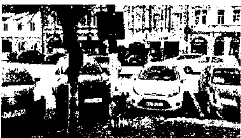
poza10.jpeg ~95 KO