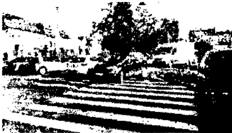
poza8.jpeg ~88 KO