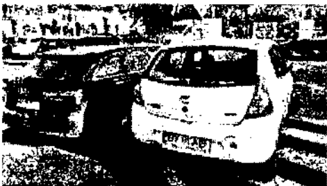
poza9.jpeg ~81 KO